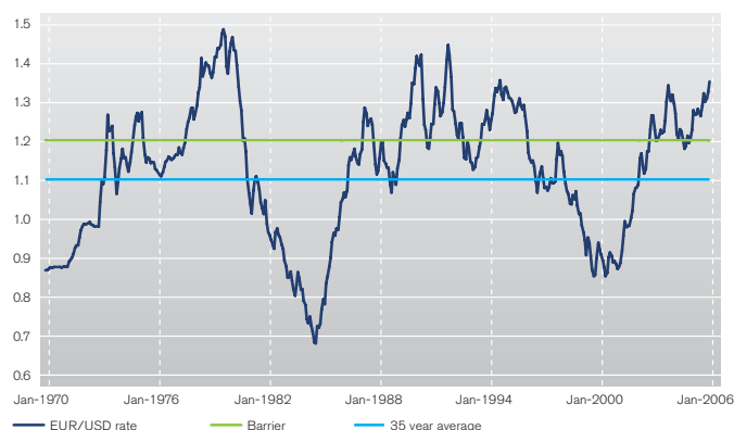
Verlauf Wechselkurs EUR/USD

payoff-Einschätzung: Eine interessante Produktidee, die auch langfristige Wechselkursschwankungen investierbar macht. Interessierte Investoren sollten sich im Klaren sein, ob sie das Produkt für spekulative Zwecke oder als Absicherungsinstrument einsetzen wollen. Da Nicolas Sarkozy eine expansive Fiskal- und Geldpolitik anstrebt, könnte sich eine Investition in diese Anlage auszahlen.